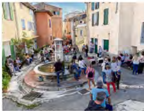
Les balades musicales dans les rues du village sont un moment fort de l'événement.

En clôture de cette journée, les quatre musiciens du groupe de jazz Muna quartet se retrouveront pour un concert exception-