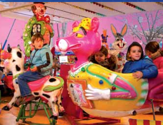
Les manèges gratuits