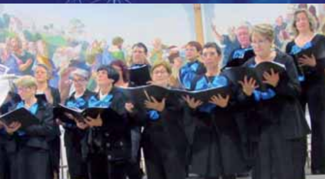
Les concerts de Noël