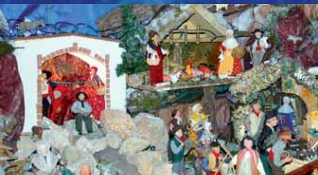
La crèche Provençale