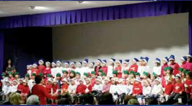
Le Noël des enfants