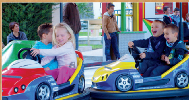
Les manèges gratuits