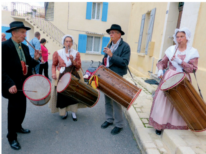
Animation devant l'église lors de la fête patronale St Lazare.