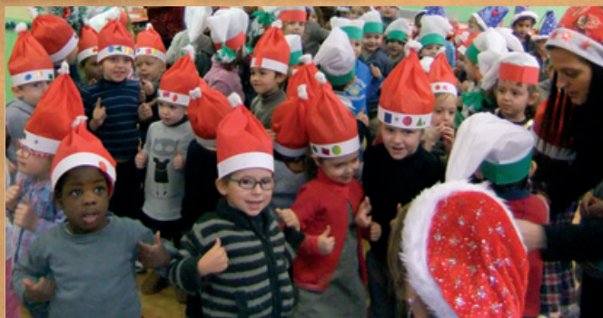
Les concerts de Noël