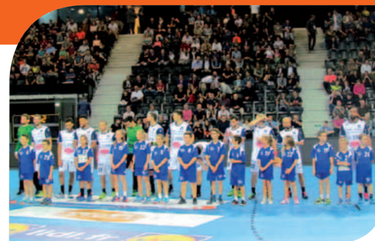
Notre école de Hand à l'Aréna d'Aix en Provence avec Monsieur Jérôme Fernandez