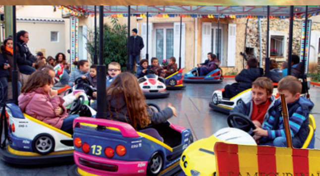
Les manèges gratuits