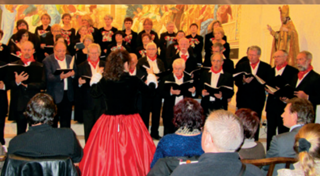
Les concerts de Noël