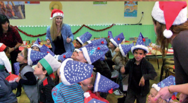
Le Noël des enfants