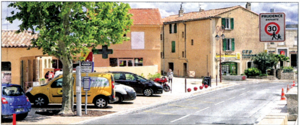
Le nouveau visage du centre ville avec ses nombreux commerçants de proximité.