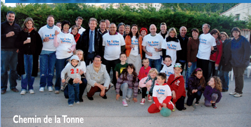
Chemin de la Tonne