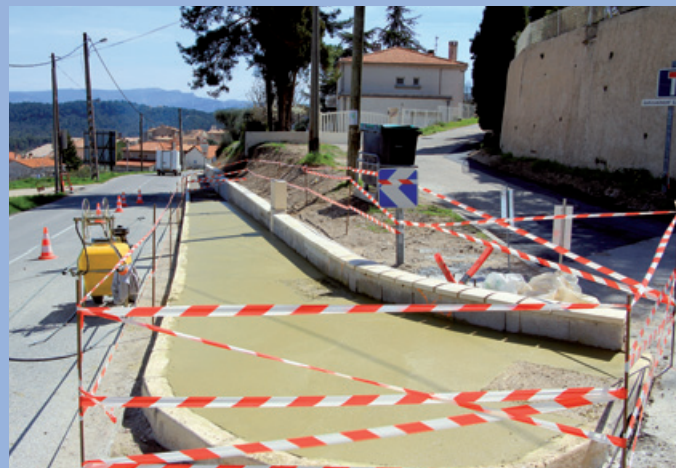
■ Avenue du village

Des travaux d'aménagement ont été réalisés pour desservir les propriétés riveraines des Chemins du Vieux Puits et Leredou. La piste de roulement a été élaborée à l'aide d'enrobés avec un système garantissant l'évacuation des eaux pluviales.