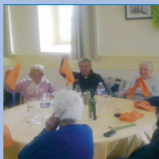
Sorties de l'Entraide