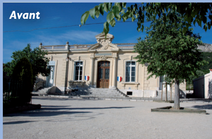
■ Place de la Mairie