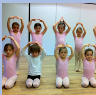
Tout le sport

La crise s'installe, le chômage est au plus haut, la désespérance sociale s'exprime plus violemment et le gouvernement ne fait rien ou presque rien. Il a raison de s'inquiéter de cette évolution sans fin car ce n'est pas les bataillons d'emplois créés dans les collectivités locales ou chez pôle emploi qui inverseront la tendance.