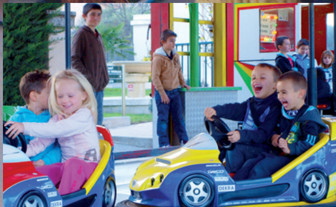
Dimanche 23 décembre, les enfants ont pu profiter des manèges gratuits, pour une journée inoubliable !