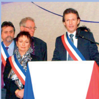
Les vœux du Maire