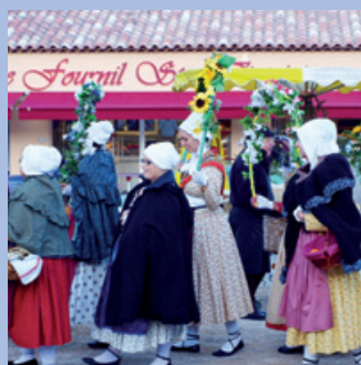
Les animations de Noël